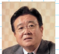
宮川 泰夫 元NHKエグゼクティブ アナウンサー